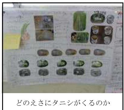
どのえさにタニシがくるのか