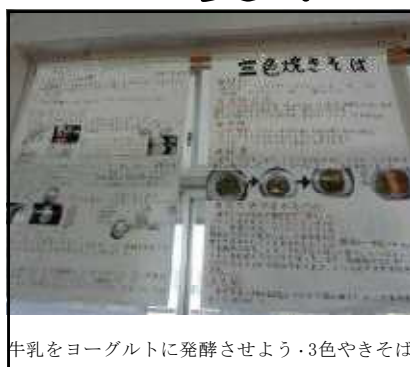
牛乳をヨーグルトに発酵させよう・3色やきそば