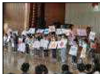
< 1年生：自己紹介（すきなもの） >

どの学年も、1年生によりわかりやすく伝えようと、工夫をこらして発表をしてくれました。1年生も学校のことがよくわかったと思います。1年生は、自分の名前と好きなものを大きな声で発表することができました。