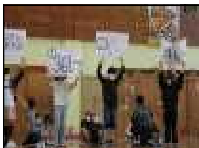
< 6年生：学校クイズ >