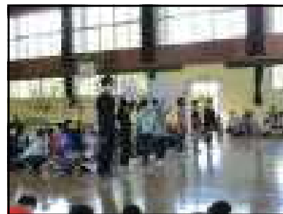
< 4年生：先生の紹介 >