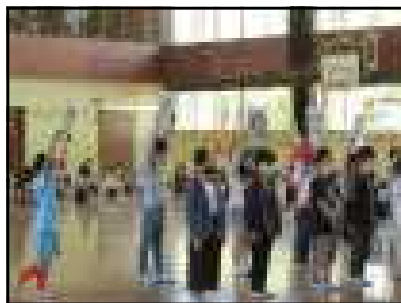
< 3年生：中庭の遊具紹介 >