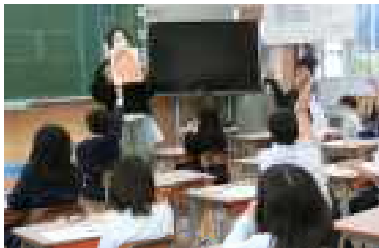
【2年生の学習の様子】

12月4日から10日までは、「第74回人権週間」でした。昭和23年（1948年）12月10日、国際連合第3回総会において、全ての人民と全ての国とが達成すべき共通の基準として、「世界人権宣言」が採択されました。世界人権宣言は、基本的人権尊重の原則を定めたものであり、初めて人権保障の目標ないし基準を国際的にうたった画期的なものです。採択日である12月10日は、「人権デー（Human Rights Day）」と定められています。法務省の人権擁護機関では、人権デーを最終日とする1週間（12月4日から12月10日）を「人権週間」と定め、全国的に人権啓発活動を特に強化して行なわれています。