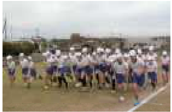
【5年生のスタートの様子】