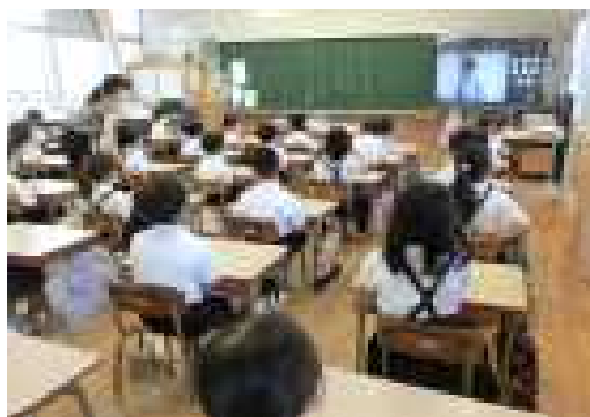
【教室で発表を聞いている1年生】