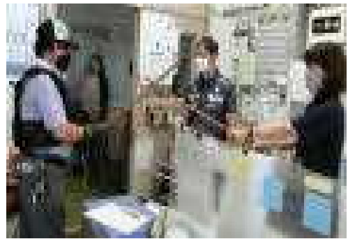
【不審者が入ってきたときの職員対応訓練の様子】