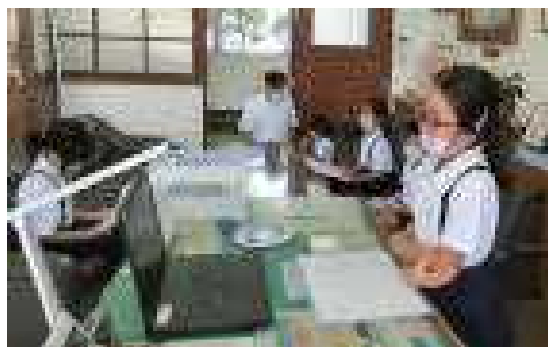
【3年生の発表の様子】

前期残りの1ヶ月半です。「主体的に課題を解決する子ども」になるよう、みんな頑張ってくれと思います。私たち立花小の職員も全力で子どもたちを応援します。どうぞ、よろしくお願い致します。