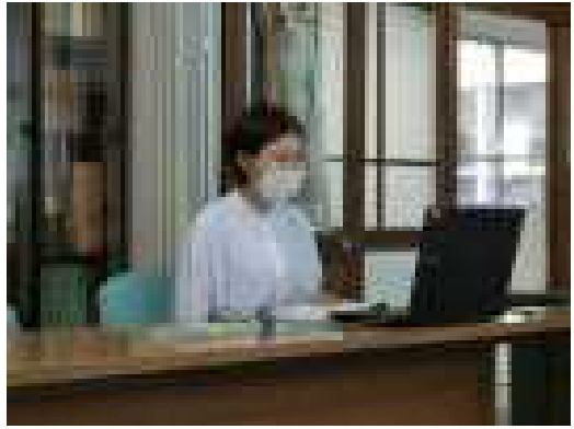
【八女警察署防犯係の方から不審者が来たときの対応について話をしてもらいました。】

※ 福岡県防犯協会連合会・福岡県警察・福岡県学校警察連絡協議会から、いかのおすしのリーフレットと小物入れをいただいています。子どもさんと一緒に見てみてください。