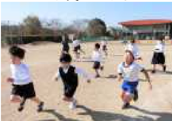
〔中休みに運動場で練習をしている様子〕

「子どもたちの体力の向上と心身の健康保持増進を図る」というねらいで11月29日に持久走記録会を行います。