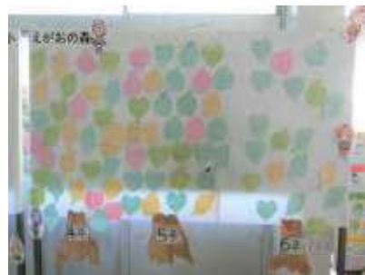
【立花小 えがおの森】

また、「友だちから言われてうれしかったこと」をカードに書き、昇降口前の「立花小えがおの森」に掲示しています。立花小を優しい言葉がいっぱいの、笑顔あふれる学校にしたいと思います。