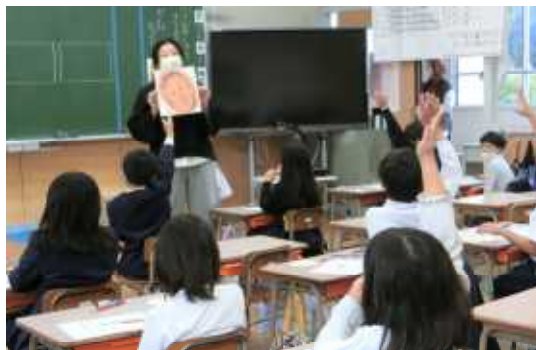
【2年生の学習の様子】

12月4日から10日までは、「第74回人権週間」でした。昭和23年（1948年）12月10日、国際連合第3回総会において、全ての国とが達成すべき共通の基準として、「世界人権宣言」が採択されました。世界人権宣言は、基本的人権尊重の原則を定めたものであり、初めて人権保障の目標とし基準を国際的にうたった画期的なものです。採択日である12月10日は、「人権デー（Human Rights Day）」と定められています。法務省の人権擁護機関では、人権デーを最終日とする1週間（12月4日から12月10日）を「人権週間」と定め、全国的に人権啓発活動を特に強化して行なわれています。