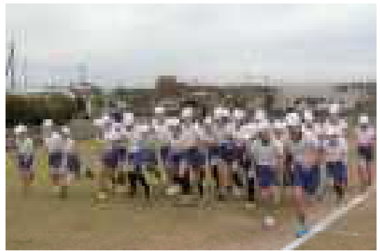
【5年生のスタートの様子】