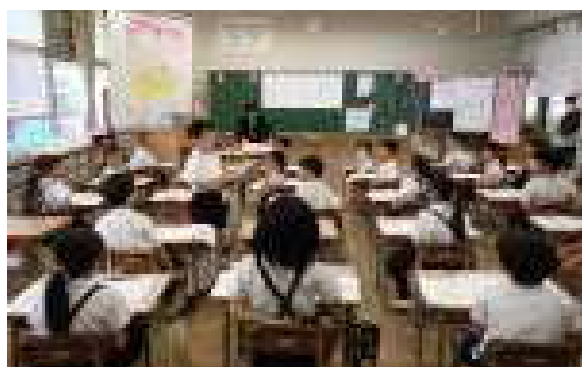
【話の聞き方が素晴らしい2年生の授業の様子】

第2回は、小学校の職員が立花中学校の授業を見せていただき、小中の連携教育をすすめていきます。