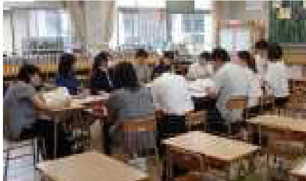
【中学校の先生方と意見交流をしている様子】