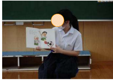
【つるつるのおとと】