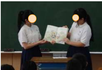
【ともだちになろうよ】