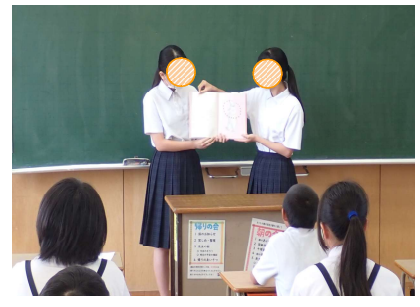
【せかいいちのいちご】