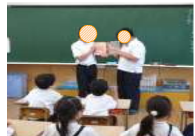
【とっておきのカレー】