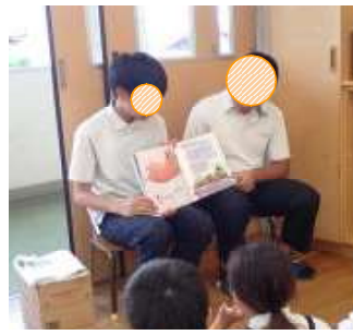
【オレ、カエルやめるや】