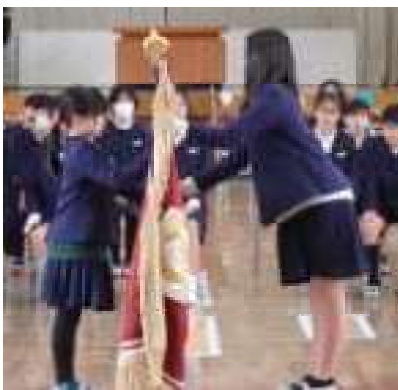
こうたいしき 【交代式】 こうき ねんせい 校旗が、6年生から ねんせい わた 5年生に渡されました。