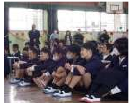
えがお ねんせい 【笑顔の6年生】 だ もの こころ いや 出し物に心が癒されて います。