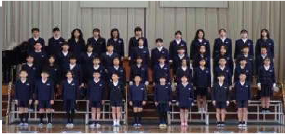
ねんせい 【6年生】 ちきゅうせい か かつしやう 「地球星歌」の合唱 おこな かしやう を行いました。下級 せい てほん うた 生のお手本になる歌 のプレゼントでした。 ねんせい すば 6年生の素晴らしさ あらた かん を改めて感じるこ ことができました。