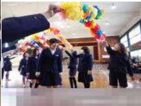
ねんせい おく 【6年生をアーチで送ります】 はな さいこう きれいな花のアーチで、在校 せい かんしや きも つた 生の感謝の気持ちを伝えます。