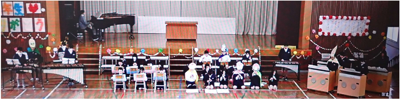
ねんせい かつそつ 【5年生の合奏とメッセージ】 たちばな さんか かつそつ 立花フードスターズも参加して、「アフリカンシンフォニー」の合奏とありがとうのメッセージを プレゼントしました。